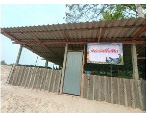
ไก่พื้นเมือง