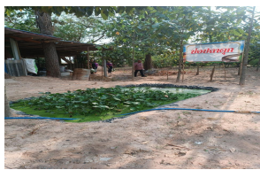
บ่อปลาตุ๊ก