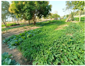
สวนผักสวนครัว