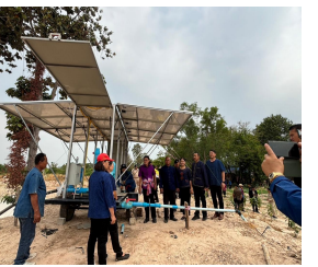
โซล่าเซลล์