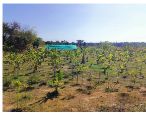
สวนกล้วย