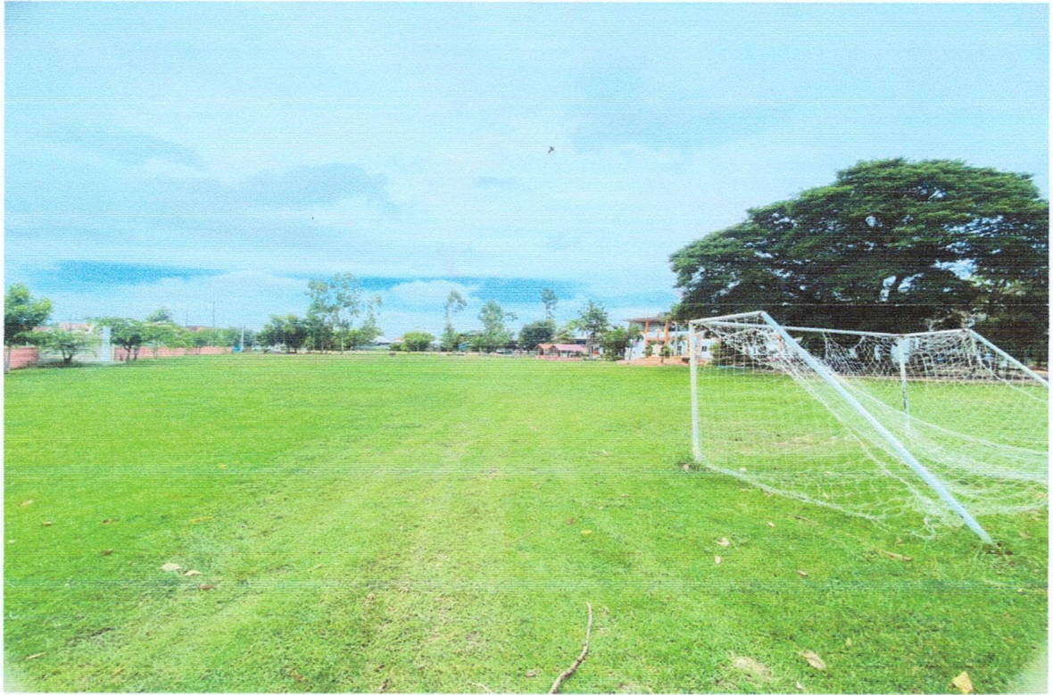
สนามกีฬาโรงเรียนบ้านโสกเชือก (ครูราษฎร์อำนวย)