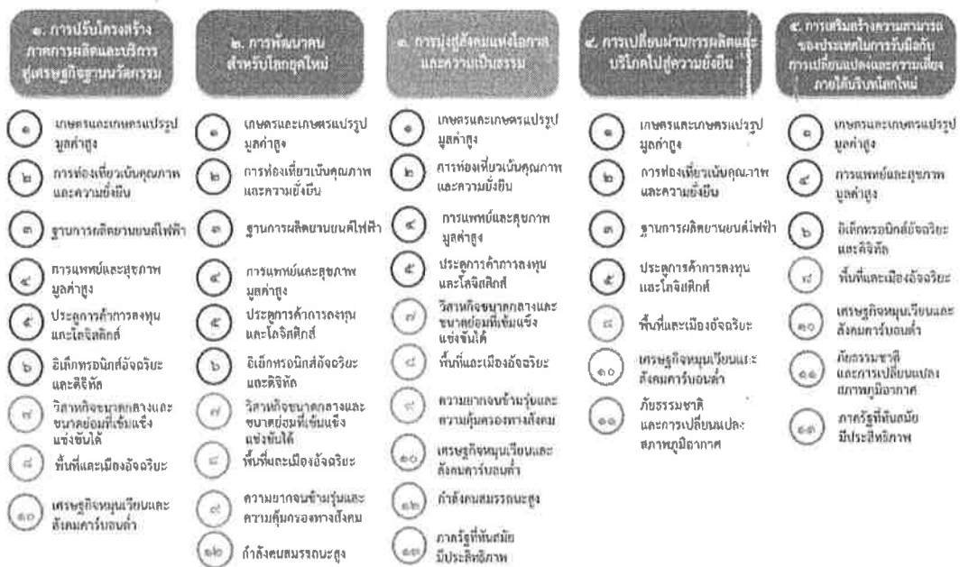
แผนภาพที่ ๓.๑ ความเชื่อมโยงระหว่างหมวดหมู่การพัฒนาที่เป้าหมายหลัก

ความเชื่อมโยงระหว่างหมวดหมู่การพัฒนาที่เป้าหมายหลักแสดงไว้ในแผนภาพที่ 3.1 โดยหมวดหมู่การพัฒนาที่กำหนดขึ้นเป็นประเด็นที่มีลักษณะเชิงบูรณาการที่ครอบคลุมการพัฒนาตั้งแต่ในระดับต้นน้ำจนถึงปลายน้ำ และสามารถนำไปสู่ผลพัฒนาทั้งในมิติเศรษฐกิจ สังคม ทรัพยากรธรรมชาติและสิ่งแวดล้อมไปพร้อมๆ กัน ทำให้หมวดหมู่แต่ละประการสามารถสนับสนุนเป้าหมายหลักได้มากกว่าหนึ่งข้อ นอกจากนี้การพัฒนาภายใต้แต่ละหมวดหมู่ไม่ได้แยกขาดจากกัน แต่มีการสนับสนุนหรือเอื้อประโยชน์ซึ่งกันและกัน