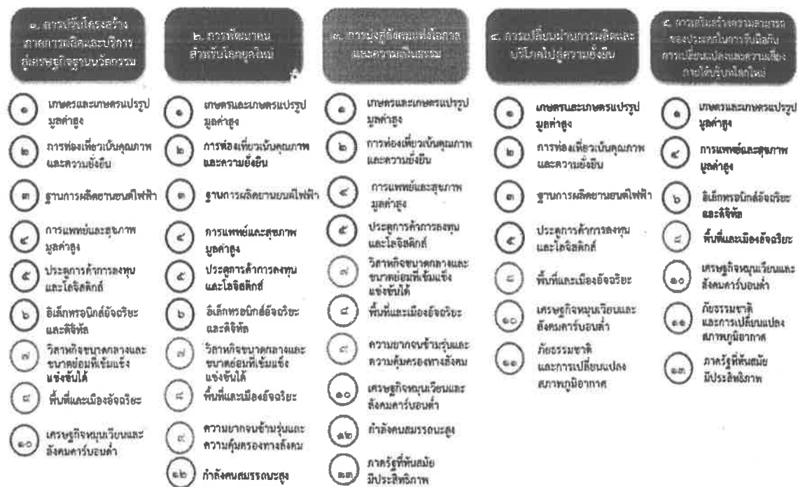
แผนภาพที่ ๓.๑ ความเชื่อมโยงระหว่างหมวดหมู่การพัฒนาที่เป้าหมายหลัก

ความเชื่อมโยงระหว่างหมวดหมู่การพัฒนาที่เป้าหมายหลักแสดงไว้ในแผนภาพที่ 3.1 โดยหมวดหมู่การพัฒนาที่กำหนดขึ้นเป็นประเด็นที่มีลักษณะเชิงบูรณาการที่ครอบคลุมการพัฒนาตั้งแต่ในระดับต้นน้ำ จนถึงปลายน้ำ และสามารถนำไปสู่ผลพัฒนาทั้งในมิติเศรษฐกิจ สังคม ทรัพยากรธรรมชาติและสิ่งแวดล้อมไปพร้อมๆ กัน ทำให้หมวดหมู่แต่ละประการสามารถสนับสนุนเป้าหมายหลักได้มากกว่าหนึ่งข้อ นอกจากนี้การพัฒนาภายใต้แต่ละหมวดหมู่ไม่ได้แยกขาดจากกัน แต่มีการสนับสนุนหรือเอื้อประโยชน์ซึ่งกันและกัน